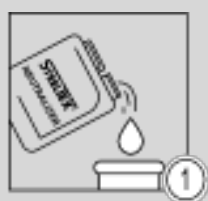
Шаг 1 - Приготовление промывочного раствора